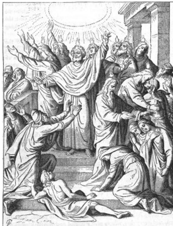
Die Herabkunft des heiligen Geistes. 1873